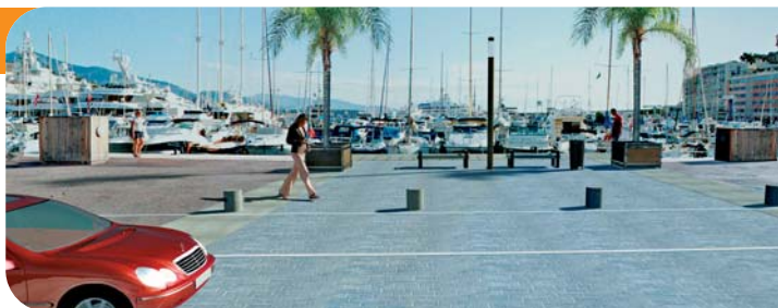
Photomontage de l'essai darse sud

En termes de matériaux et lignes de mobilier, l'option retenue a été celle de la simplicité. Elle se traduit par la pureté, la légèreté et l'élégance des formes et des matériaux. L'assise des bancs, les bornes de voirie, les bandes