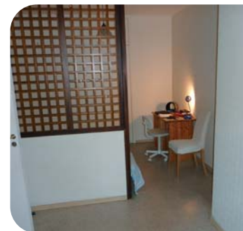
Exemple de logement

Ces logements peuvent également être utilisés pour des hébergements ponctuels. Par exemple