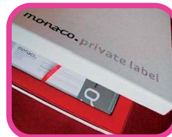
Ci-dessus : Le coffret