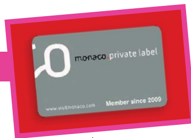
La carte nominative

Les premières retombées de ce lancement ont déjà été observées. En effet, trois couples chinois invités à cet événement mais en déplacement lors du dîner n'ont pas hésité à modifier leur planning. Ils ont pu séjourner en Principauté et bénéficier des privilèges exclusifs de ce nouveau programme.