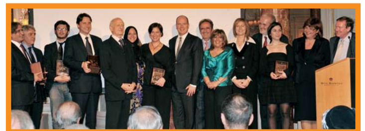
S.A.S. le Prince Albert II et les lauréats

Le 5 novembre dernier, Monaco a accueilli le prix Méditerranéen du Journalisme organisé par la Fondation Anna Lindh*.